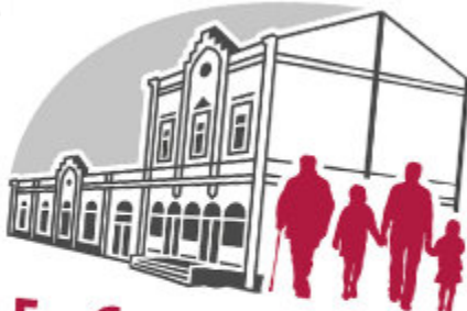
Ev. Gemeindehaus Odenkirchen