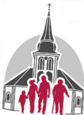
Ev. Kirche Odenkirchen