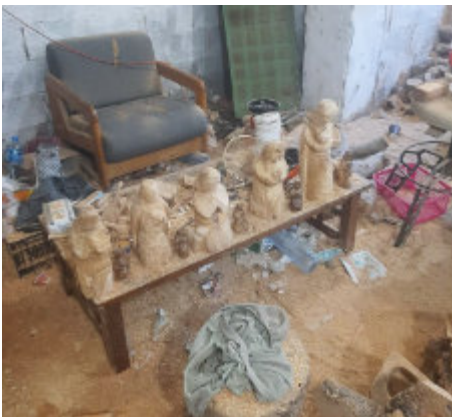
Krippenfiguren aus Olivenholz