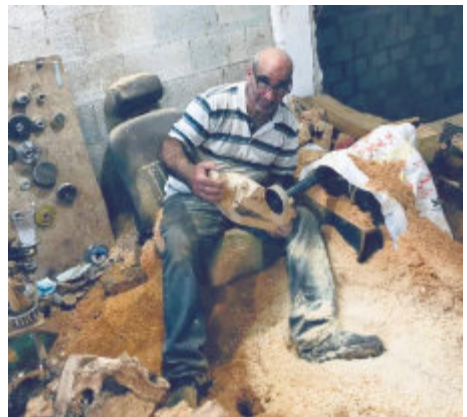
Einblick in die Werkstatt des Künstlers