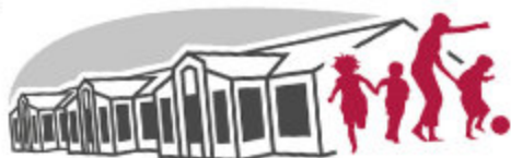
Ev. Bewegungskindergarten Geistenbeck