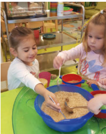
Der ganz normale Wahnsinn