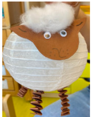
Martinsfest mit den Kleinen