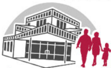
Ev. Gemeindezentrum Geistenbeck