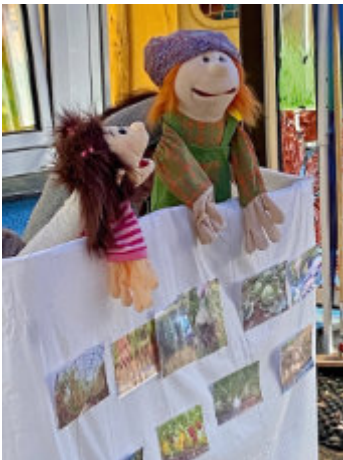
Gottesdienst fast wie immer