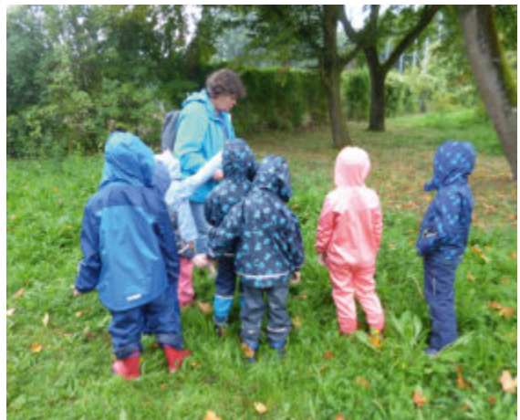
Naturagenten sind wieder unterwegs