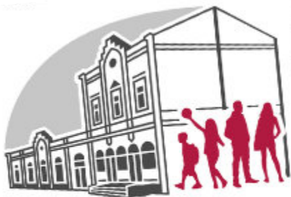
Ev. Jugendzentrum Odenkirchen