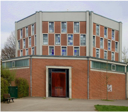
St. Michael – Odenkirchen