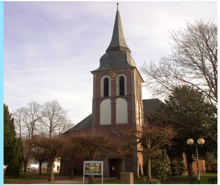
Ev. Kirche Odenkirchen