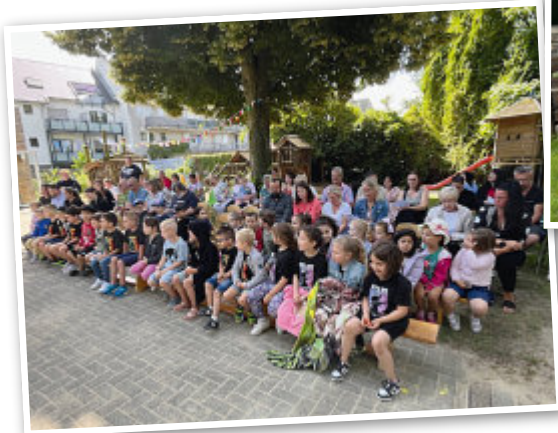
Gottesdienst unter freiem Himmel

Das interkulturelle Fest in unserem Haus zeigte sich als voller Erfolg. Eltern auf Augenhöhe zu begegnen, ist unser Ziel und das Fest war das beste Beispiel. Hier konnten wir von den Eltern lernen, was wichtig in der jeweiligen Kultur, Religion oder Küche ist. Eltern bauten ihre Stände auf und zeigten voller Stolz landestypische Spezialitäten. Wir suchten auch nach Aktionen, die unabhängig von Sprache funktionieren, damit alle verstehen und fühlen konnten. Also kam eine grandiose Seifenblasenkünstlerin zu uns und nahm uns mit auf eine magische Reise. Die Kinder und auch die Erwachsenen ließen sich verzaubern von kleinen und großen Seifenblasen mit und ohne Rauch, konnten diese schnappen oder auf ihren Händen landen lassen – was für ein Spaß! Viele Gäste besuchten uns und nahmen bunte und tolle Eindrücke mit. Besonderes Highlight an diesem Tag: eine Tanzgruppe aus Sri Lanka gab ihr Können zum Besten. Ehemalige Kinder und deren Freunde tanzten für uns Tempeltänze und ermöglichten, dass wir gedanklich mit ihnen in andere Welten reisen konnten. So viel Anmut, so viel Lebensfreude und Energie - es waren magische Momente. Danke dafür!