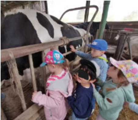
Die Kühe sind aber groß!